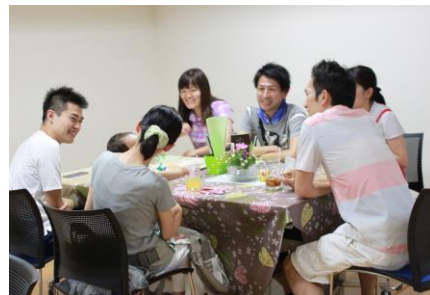
【モーニングカフェの様子】

3次計画B部会のメンバーが運営スタッフとなり、UR賃貸住宅アーバンラフレ鶴舞公園の居住者を中心に誰もが気軽に寄れる場として集会室でモーニングカフェを年2回開催した。第1回目は(株)松屋コーヒー本店様の協力を得て、7月25日(土)に開催した。その後、集会室の机やイス以外に冷蔵庫、コップ等、その他カフェに必要な備品を揃え、第2回目を10月31日(土)に開催した。このイベントには高齢から若い世代までの参加があり、参加人数は第1回目34名、第2回目39名であった。参加者全員が「今後もこのようなイベントに参加したい」、また高齢の方からは「久しぶりに会えた」、若い世代からは「交流できてよかった」などの声をいただく。第1回と第2回のカフェを終え、「交流を求めている人はいる」ことがわかった。