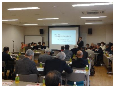
【推進協研修の様子】

参加人数は21名。来年度も次世代へ地域福祉活動を繋ぐため、実践事例を伝える研修会を開催する。