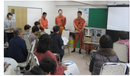
【正木荘防災UP講座の様子】

前年の「前津荘座談会」を経て、普段のちょっとした困りごとの聞き役・お手伝いさん役をする“おたすけさん”を前津荘の中で募集した。20名の住民が“前津荘おたすけさん”に登録し、活動を開始することとなった。活動内容は「買い物や病院の付き添い」「認知症の疑いがある住民をいきいき支援センターにつなぐ」等の報告があがっている。