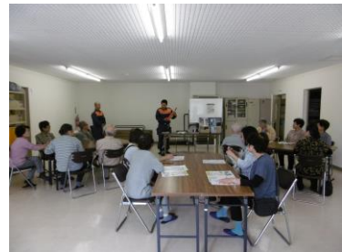
【千早荘防災力UP講座の様子】

市営千早荘では、女性の高齢者が多く参加しており、年齢に関係なく参加できる雰囲気をつくりたいという意見により、講座「美味しいコーヒーをみんなで飲みましょう」でのコーヒーの淹れ方体験や「防災力UP講座」でのお菓子で作れる簡単な非常食の試食など工夫した内容を提供した。