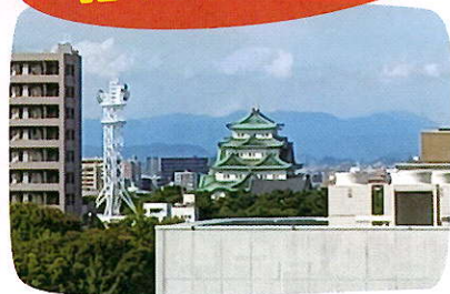
学校の窓から「名古屋城」が見えます★

認知症カフェとは、認知症のご本人やご家族のほか、地域の方や専門職の皆様など、誰もが気軽に集い交流できる場です。現在、中区では8か所で開催しています。 今回は、丸の内駅から徒歩5分の場所にある、理学・作業名古屋専門学校で開催されている「さんまる茶屋」をご紹介します。 会場は眺めのよい場所で、ゆったりとご参加いただけます。(ボードゲームもあります。)開催は第3木曜日の14~16時で、学生さんとも交流ができますよ。飲み物代(100~300円)は実費が必要です。 センターでは、区内の認知症カフェ一覧をご用意しておりますので、ぜひご活用ください。