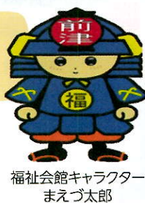
福祉会館キャラクター まえづ太郎

福祉会館は、名古屋市内にお住まいの60歳以上の方がいきいきとしたシニアライフを楽しむための施設です。