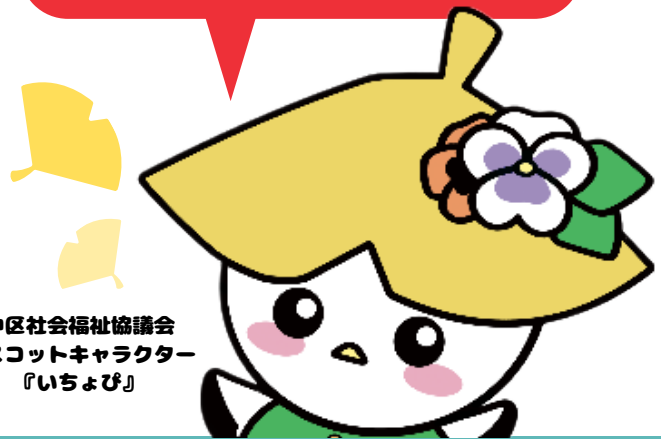
中区社会福祉協議会 マスコットキャラクター 『いちよび』